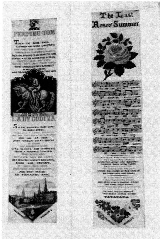
写真4 リボンの見本帳から