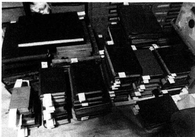
写真3 譲り受けた蔵書の山