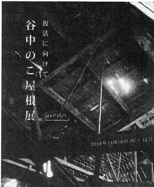
図3 (下)「復活に向けて 谷中のご屋根展 in HAGISO」の案内チラシ