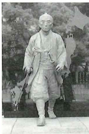
図3 伊能忠敬 (1745-1818)

江戸時代前半まで日本には現在の基準で正確な地図はなく、様々な地点の関係を表示する簡単な絵図しか作成されていなかった。そのような時代に全国の正確