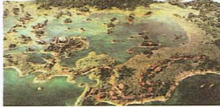
図4 象潟地震(1804)以前の象潟