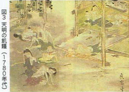
図3 天明の航海(1780年代)