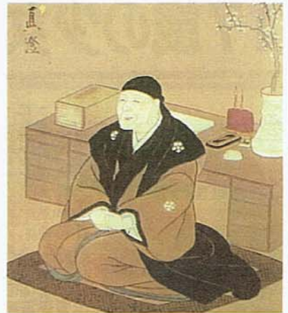
菅江 真澄 (1754-1829)