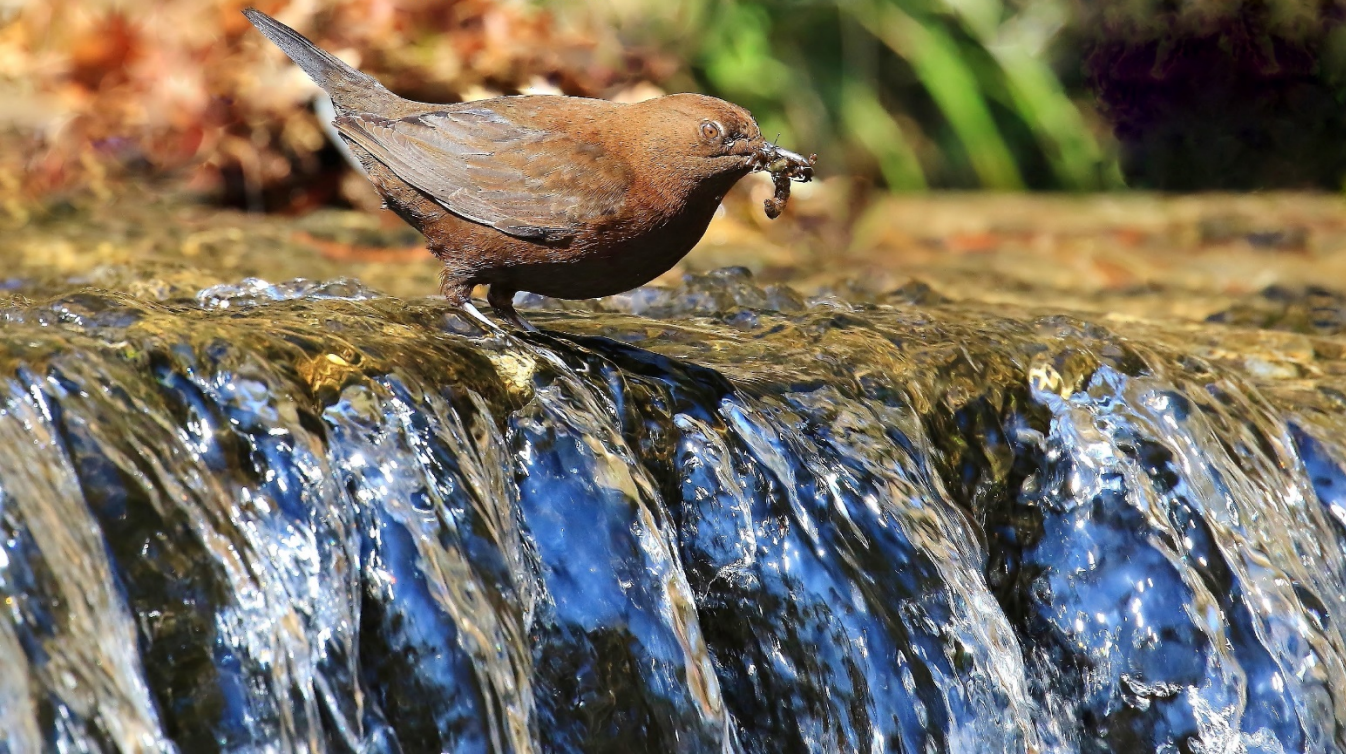
2019/03/05 岡山県吉備中央町 滝の上にとまるカワガラス