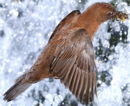
2019/03/05 岡山県吉備中央町 滝に突入するカワガラス