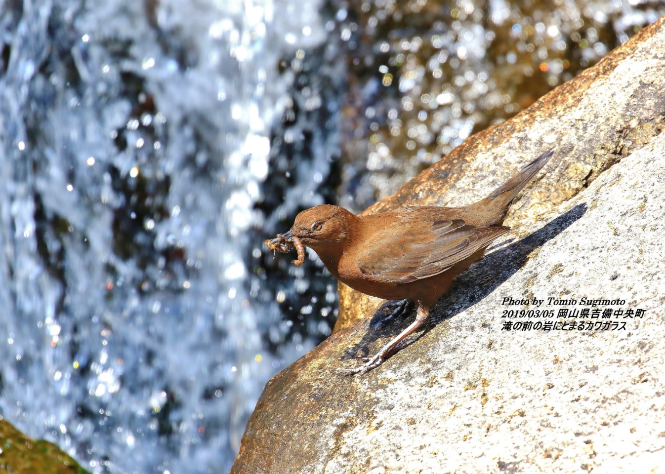
2019/03/05 岡山県吉備中央町 滝の前の岩にとまるカワガラス