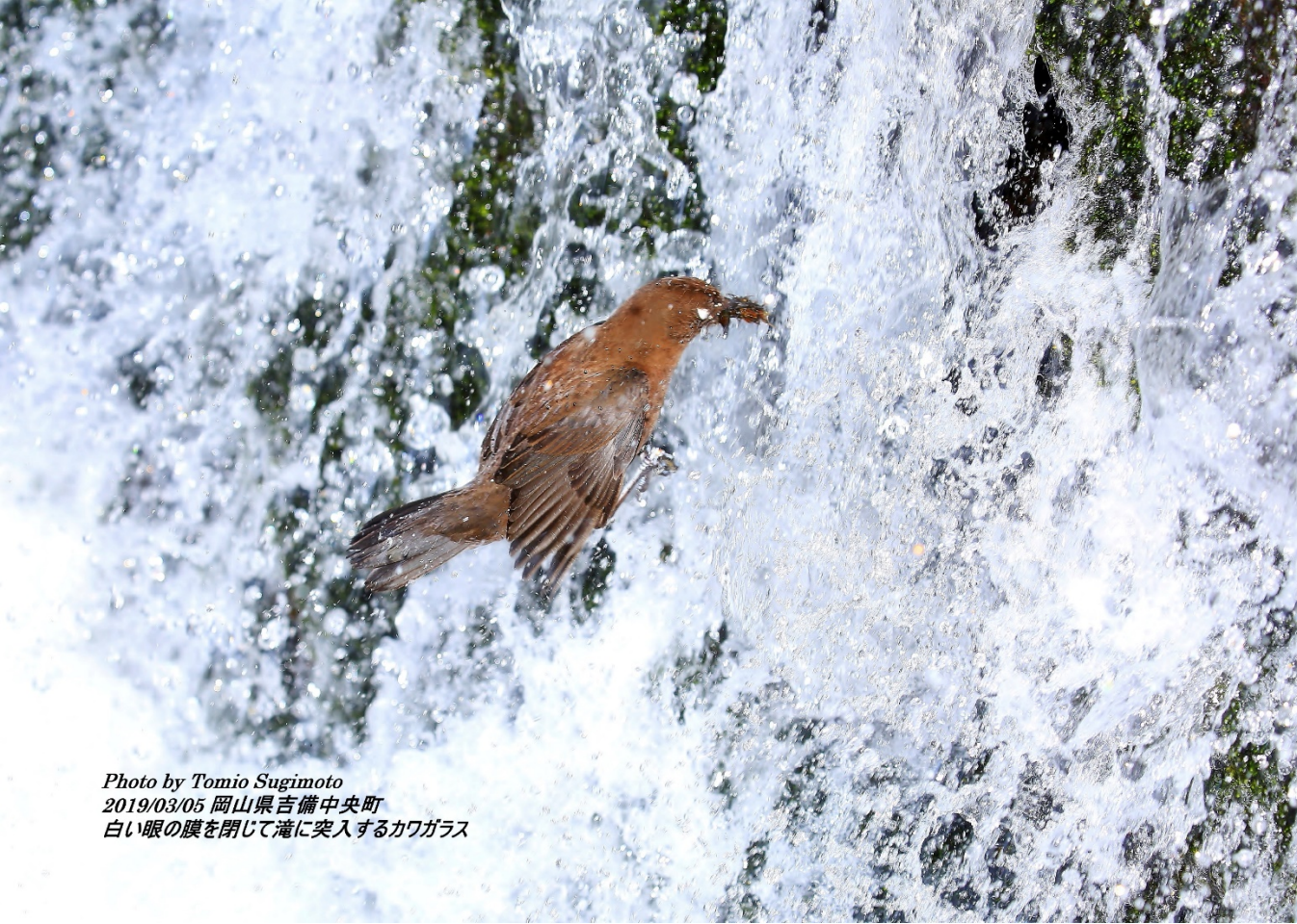
2019/03/05 岡山県吉備中央町 白い眼の膜を閉じて滝に突入するカワガラス