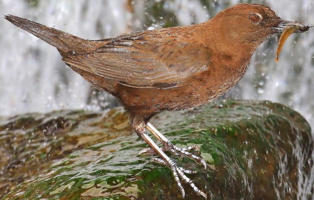
2019/03/02 岡山県吉備中央町 滝の前の岩にとまるカワガラス